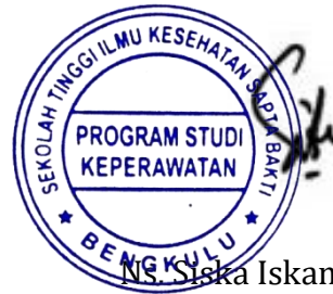
Ns. Siska Iskandar, MAN NIK. 2009.034