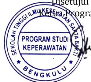
NS. SISKA ISKANDAR, MAN NIK. 2009.034